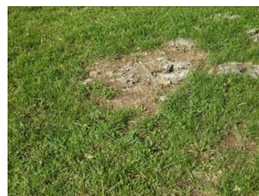
Her slår størrelse 46 ikke til. Hvis der er ret mange pletter på denne størrelse, skal marken lægges om.

Det er især markerne i omdrift, man skal være meget kritisk med. Hvis marken skal bruges til afgræsning, skal der være 30-40 planter pr. meter i sårækken. Hvis marken skal bruges til slæt, skal der være 20-25 planter pr. meter i sårækken. Der er tale om både græs og kløver, når man taler om græsmarksplanter. Pas på ikke at tælle ukrudt med! Der må ikke være store pletter med dødt. Man siger, at hvis der er større områder med pletter på størrelse med en gummistøvle størrelse 46, så skal der sås i marken, eller den skal lægges om.